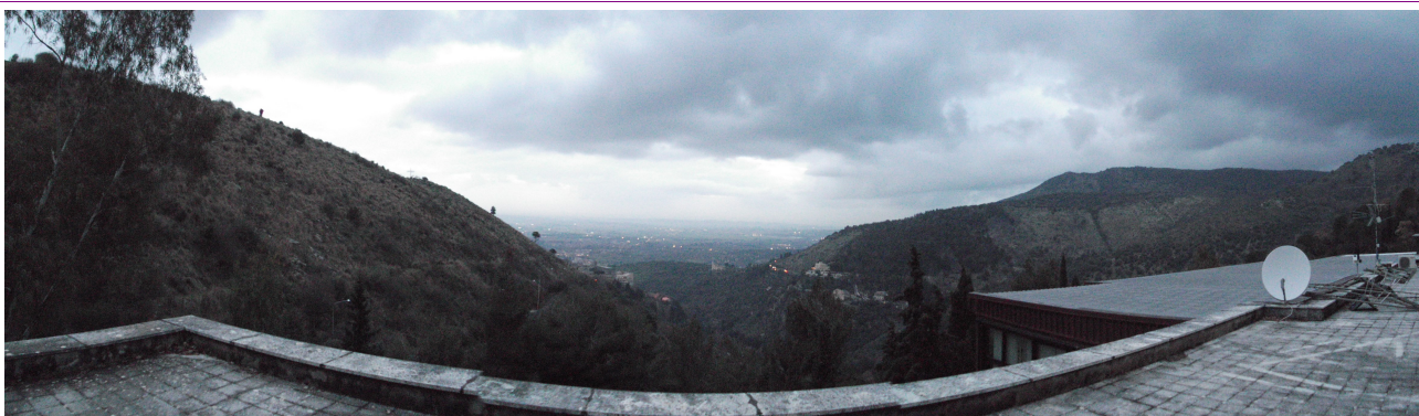
La visuale che avevamo da dove era piazzata l'antenna (Foto)