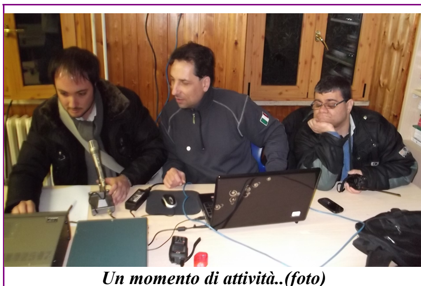
Un momento di attività..(foto)